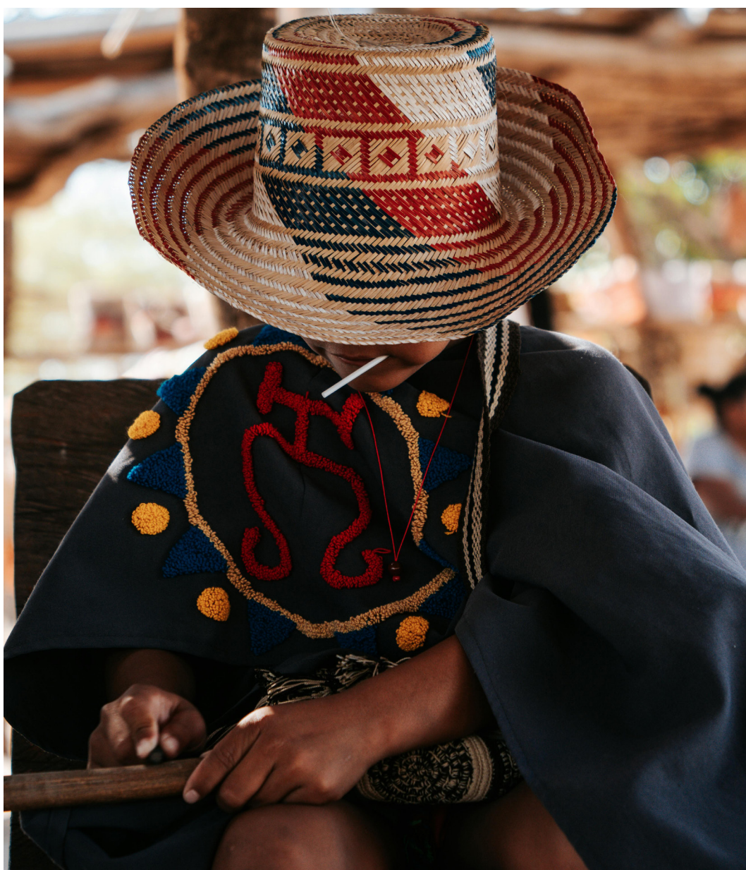
Note: Guajira, La Guajira, Colombia. www.pexels.com

Este informe refleja las discusiones sostenidas en el marco del Taller y comparte una ruta de trabajo con el objetivo de identificar posibles áreas de colaboración para el fortalecimiento de los datos sobre Pueblos Indígenas en Colombia. El capítulo 1 identifica y resume los datos disponibles sobre los Pueblos Indígenas en Colombia, incluyendo información oficial y datos ciudadanos. El capítulo 2 sistematiza los desafíos y oportunidades en relación con la recolección y difusión de los datos sobre Pueblos Indígenas. El capítulo 3 identifica las razones por las cuales es necesaria la colaboración entre entidades estatales y organizaciones de los Pueblos Indígenas en el marco de la producción de datos sobre Pueblos Indígenas. Por último, el capítulo 4 presenta las principales conclusiones.