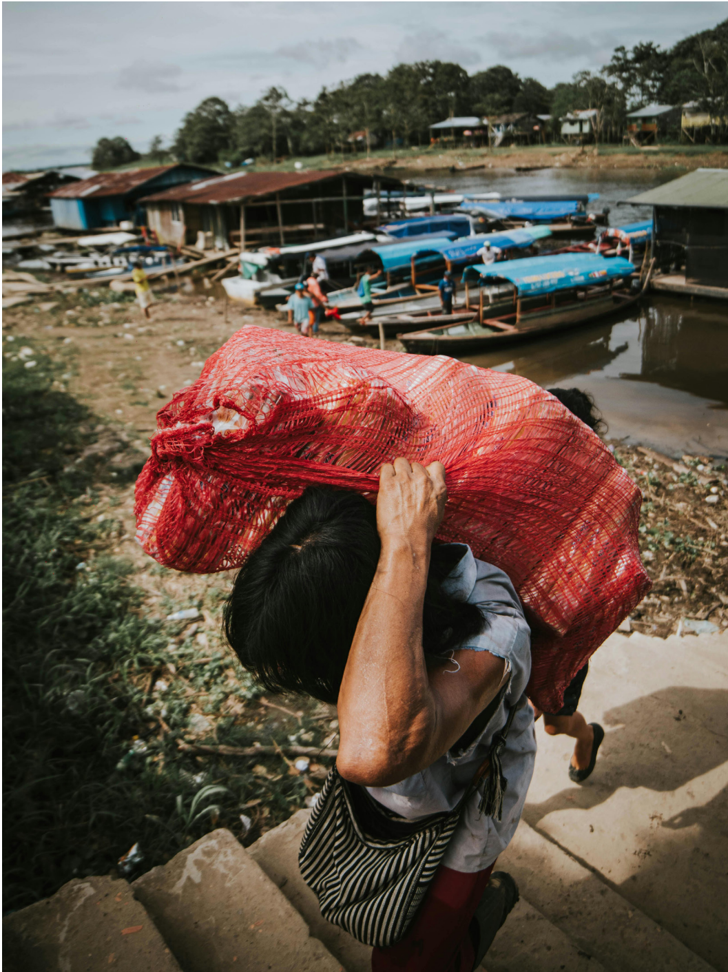
Note: Leticia, Amazonas, Colombia. Woman Holding a Red Bag in Harbor.

Adicionalmente, algunos desarrollos en el marco normativo han reconocido la posibilidad de usar datos generados por la ciudadanía como fuente para la toma de decisiones. A modo de ejemplo, con base en el Decreto 724 de 2024, tendrá en cuenta los autocensos o censos propios para expedición de la certificación de información para la distribución de los recursos de la Asignación Especial del Sistema General de Participaciones.