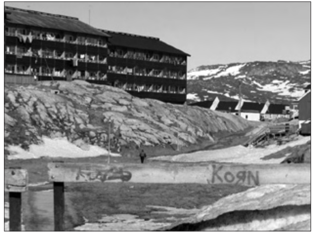
Imágenes de la capital, Groenlandia

ral, Groenlandia como tal puede ser considerada como una sociedad urbana.