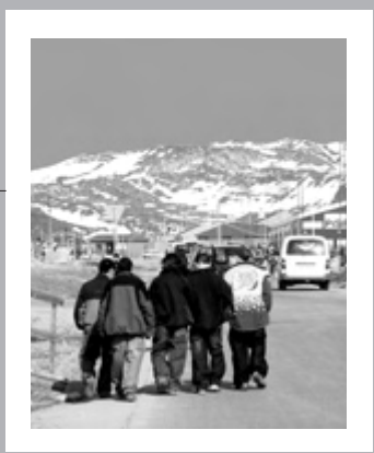
Cubierta: Joven indígena de México

Esta publicación ha sido posible gracias al apoyo financiero de la Unión Europea. El contenido de esta revista es exclusiva responsabilidad de IWGIA y bajo ninguna circunstancia refleja la posición de la Unión Europea