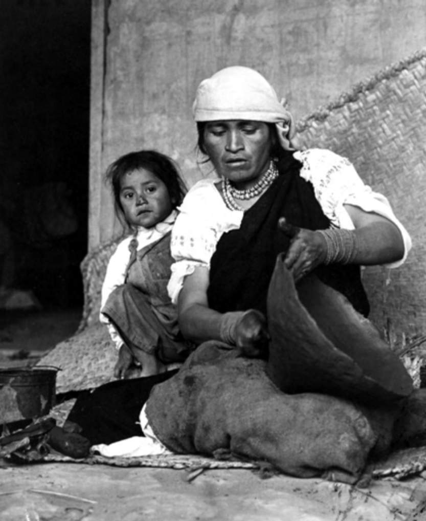
Indígenas de Otavalo

tantes personas las que estaban en la hacienda y se fueron a vivir en Agualongo, otros en Quinchinche, Larcacunga, Quillupamba, Rinconada, Gualsaquí, Moraspungo. Esas personas salieron a otras partes comprando los terrenos porque que no podían servir por el suficiente maltrato que recibían por los hacenderos, más al principio les había regalado el terreno que era plano entonces cuando salieron les quitaron todito diciendo que es bueno para trabajar con maquinarias y así se acabaron saliéndose otras partes. 6