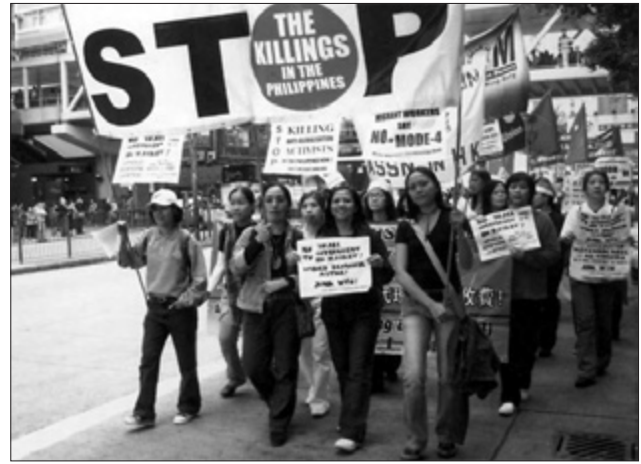
Campaña para detener las matanzas contra los pueblos indígenas

10 millones de trabajadores filipinos en el extranjero documentados en 192 países de todo el mundo. Alrededor de 120.000 empleados domésticos filipinos viven en Hong Kong, de los que 10.000 proceden de la región de la Cordillera. En 2003, la Administración para el Bienestar de los Trabajadores en el Extranjero- Región Administrativa de la Cordillera (OWWA-CAR) documentó 50.836 trabajadores filipinos en el extranjero, la mayoría mujeres en el servicio doméstico. Esta cifra sería aún mayor si se incluyera a quienes hacen su solicitud fuera de la región de la Cordillera y a los que se marchan ilegalmente.