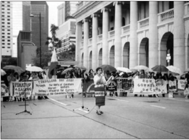
Día de La Cordillera en Hong Kong - 2001