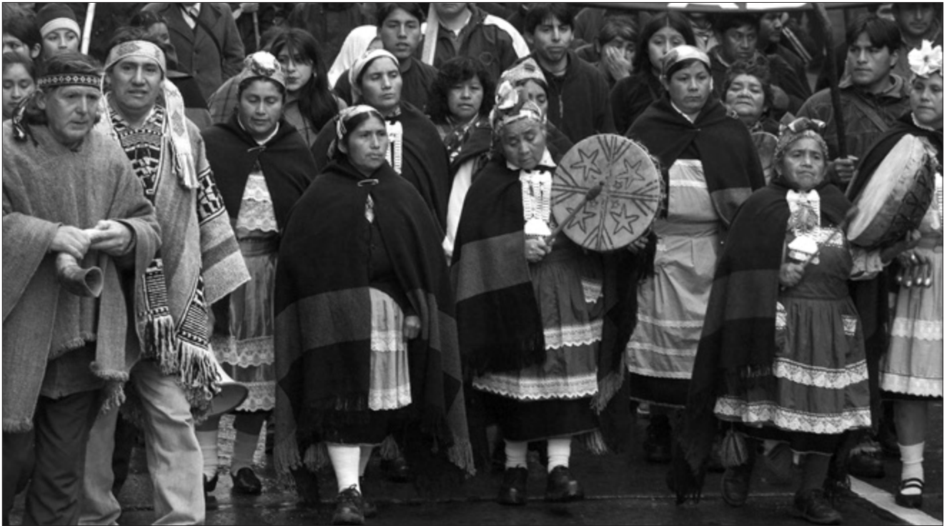
Indígenas mapuches

Región Metropolitana de Santiago, la Región de la Araucanía y la Región del los Lagos-Región de los Ríos. Estas mismas regiones son asimismo las que más expulsan gente. Esto muestra que una parte importante de la migración se da en torno a las áreas habitadas históricamente por los pueblos indígenas. Cuando es a mayor distancia el destino es Santiago. 19 Las regiones que más expulsan gente son las Regio-