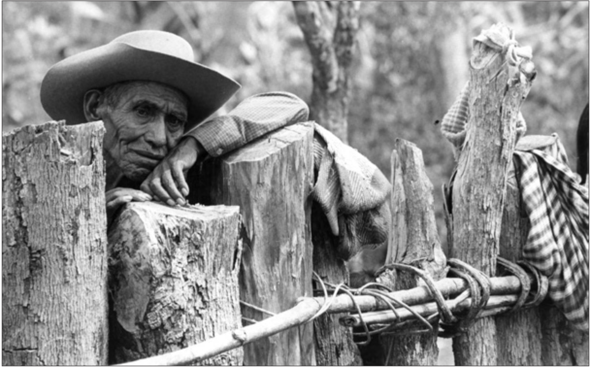
Refugiado guatemalteco