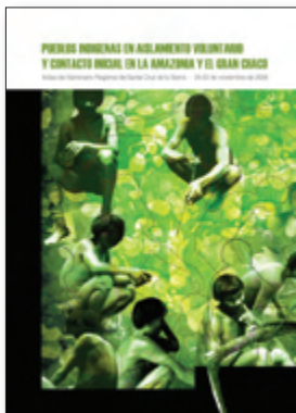
Alejandro Parellada (ed.)

IWGIA - CENTRO DE ESTUDIOS RURALES (MEXICO) IIAM (UNIVERSIDAD CATOLICA DEL NORTE, CHILE) ISBN 956-8018-33-6 - 378 páginas