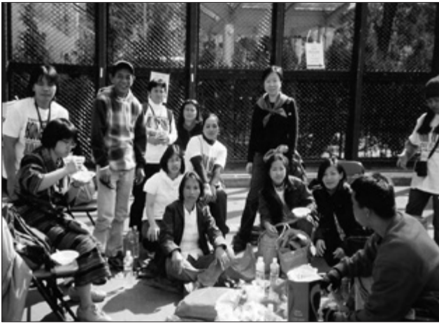
Celebrando la protesta ministerial de WTO en 2006