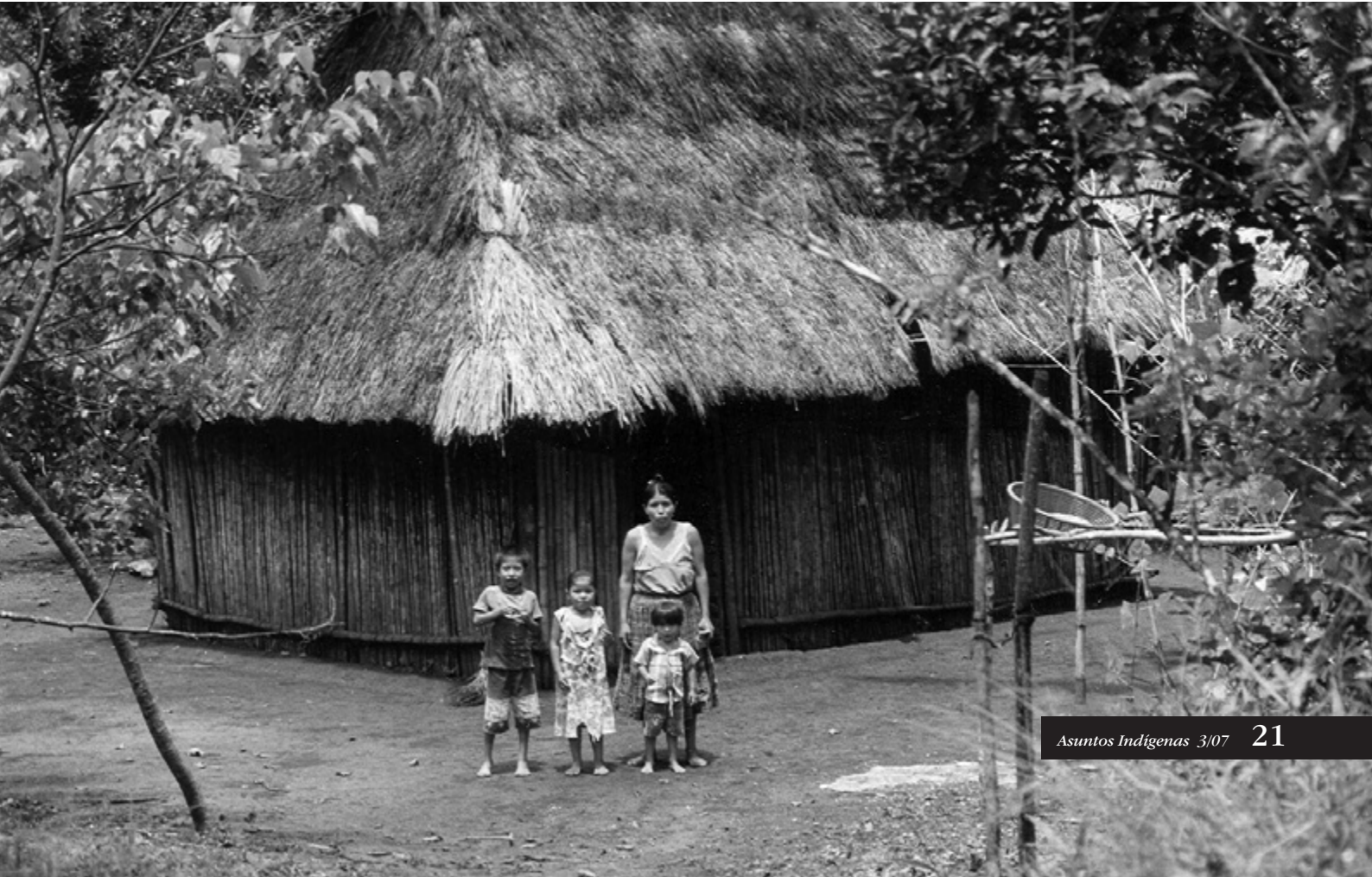
Familia maya desplazada