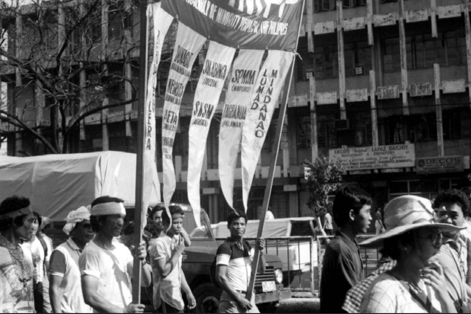
Marcha indígena en Filipinas

lucha de la población de la Cordillera, incluso desde tierras lejanas.