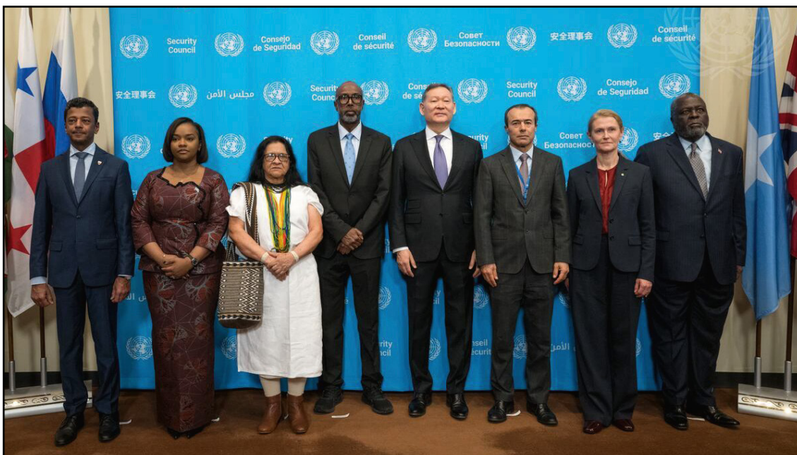
Ceremonia de instalación de los miembros no permanentes del Consejo de Seguridad de las Naciones Unidas para el período 2026-2027, Sede de las Naciones Unidas, Nueva York, 2 de enero de 2026.

Esta parálisis ha contribuido a que las potencias sigan operando sin consecuencias. Rusia veta resoluciones sobre Ucrania a pesar de ser el agresor; Estados Unidos veta resoluciones sobre Palestina incluso cuando la Corte Internacional de Justicia ha determinado que Israel está cometiendo violaciones del derecho humanitario; China veta resoluciones sobre Myanmar mientras respalda a la junta militar.