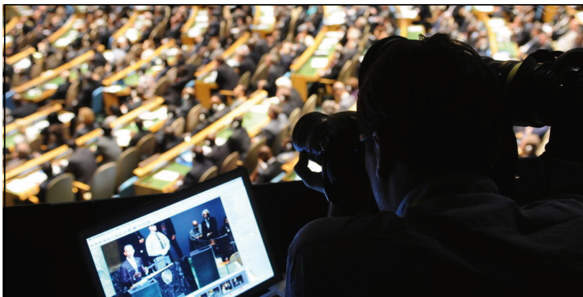
Asamblea General durante la apertura del debate general del 66º período de sesiones de la Asamblea General de las Naciones Unidas, Sede de la ONU, Nueva York, 21 de septiembre de 2011.

La segunda administración Trump ha marcado un punto de inflexión crítico en la postura de Estados Unidos hacia el sistema internacional, que va más allá de los desacuerdos de política exterior y supone un cuestionamiento de los principios que el propio Estados Unidos contribuyó a consagrar en 1945–1948.