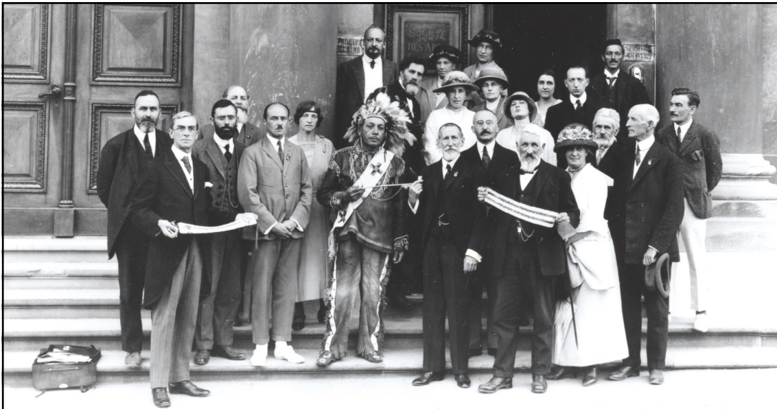
En 1923, el líder haudenosaunee Deskaheh viajó a Ginebra para intentar presentar el caso de su pueblo ante la Sociedad de Naciones.

Bajo el sistema de mandatos de la Liga, los habitantes de territorios coloniales —incluidas las poblaciones indígenas—también pudieron presentar peticiones ante los abusos de las potencias mandatarias, creando un canal incipiente para visibilizar las violaciones coloniales. Cuando en 1945 se negoció la Carta de la ONU en San Francisco, esos antecedentes se reflejaron indirectamente en los capítulos sobre territorios no autónomos y administración fiduciaria, que aludían al bienestar de las “poblaciones indígenas” bajo administración colonial, aunque aún no las reconocían como sujetos colectivos de derechos 35 .