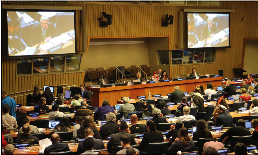
Sesión del Foro Permanente para las Cuestiones Indígenas en la sede de las Naciones Unidas, en Nueva York, abril de 2023.