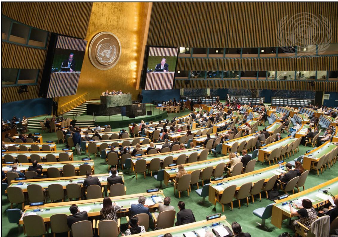
Salón de la Asamblea General durante la apertura de la Conferencia Mundial sobre los Pueblos Indígenas, con la intervención del Secretario General Ban Ki-moon, Sede de las Naciones Unidas, Nueva York, 22 de septiembre de 2014.

Como ha advertido Guy Ryder, si no se reconoce explícitamente que los sistemas vigentes han fracasado en proteger a la mayoría, ninguna reforma será posible; y como recordó Mark Carney, si no estamos en la mesa, estamos en el menú. La elección, en última instancia, es entre aceptar la normalización de un orden regido por la fuerza o emprender transformaciones profundas — democratización, financiamiento, cumplimiento— que permitan que el multilateralismo vuelva a ser una herramienta de protección efectiva de los derechos humanos de todas las personas y de todos los pueblos, en particular de quienes históricamente han sido dejados al margen, incluidos los pueblos indígenas.