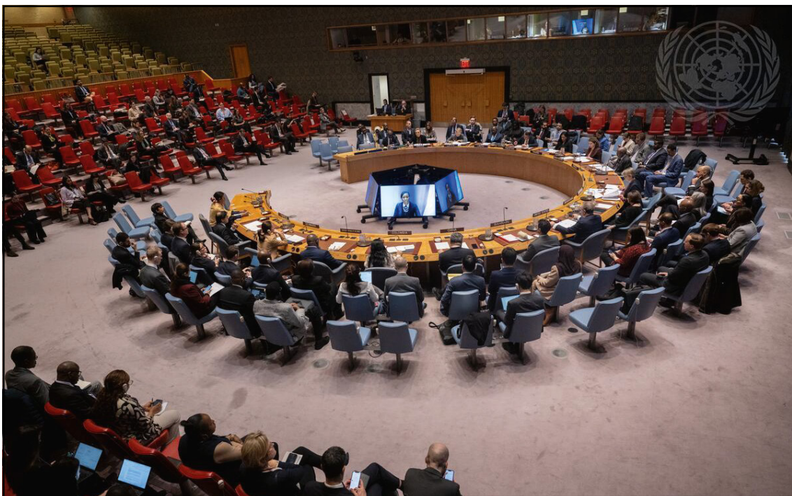
Consejo de Seguridad de las Naciones Unidas reunido en la sede de la ONU, Nueva York, 2026.

Un cuerpo de investigaciones recientes muestra que plataformas como TikTok, YouTube y X han sido instrumentalizadas de este modo, particularmente en contextos autoritarios del Sur Global, donde la combinación de alta penetración móvil y marcos regulatorios débiles facilita la captura del ecosistema digital por parte de gobiernos y élites aliadas. Informes comparativos sobre la libertad en internet han documentado que, en la última década, tanto regímenes autoritarios como democracias en retroceso usan estas plataformas para orquestar campañas de desinformación, bloquear contenidos políticos sensibles, sabotear las comunicaciones durante protestas y rastrear a activistas y periodistas que organizan o denuncian abusos en línea. Según los análisis más recientes de organizaciones como Freedom House, al menos decenas de países ya emplean un “manual digital autoritario” que combina vigilancia masiva, manipulación algorítmica de la información y ataques coordinados contra voces críticas: los gobiernos no necesitan tanques en las calles si pueden colonizar la realidad informativa de millones de ciudadanos, definiendo qué se ve, qué se oculta y a quién se estigmatiza como enemigo interno 59 .