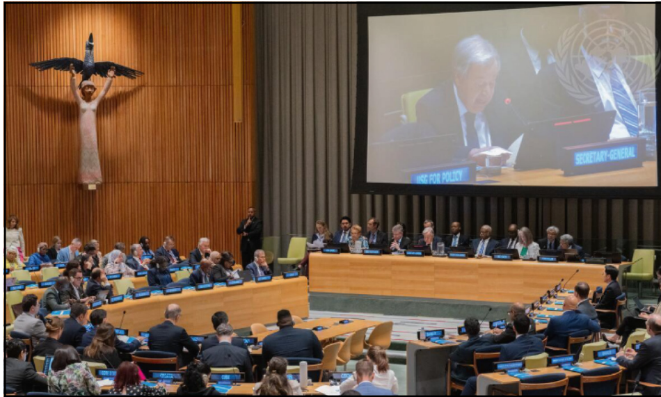
El Secretario General de las Naciones Unidas, António Guterres (en pantalla), interviene en la reunión plenaria oficiosa de la Asamblea General sobre la iniciativa UN80, Sede de las Naciones Unidas, Nueva York, 1 de agosto de 2025.