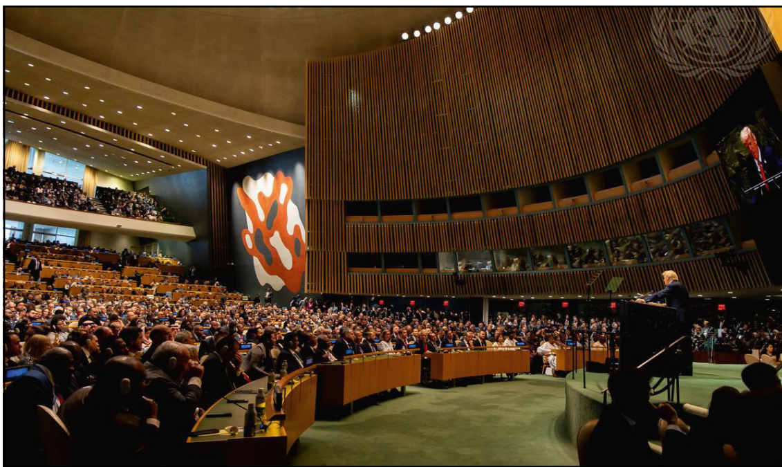
El presidente de los Estados Unidos, Donald J. Trump, interviene en el debate general del 80º período de sesiones de la Asamblea General de las Naciones Unidas, Nueva York, 23 de septiembre de 2025.

Más recientemente, los diversos análisis han identificado un factor que no había sido considerado en los debates previos sobre autoritarismo: Internet y las plataformas digitales se han convertido en actores políticos centrales, no meramente en medios de comunicación. La arquitectura de estas plataformas —sus algoritmos de recomendación, sus modelos de negocio publicitario basados en maximizar la atención y la polarización, sus sistemas opacos de moderación de contenidos— ha sido crecientemente capturada y manipulada por actores autoritarios y redes afines para reconfigurar el espacio público digital.