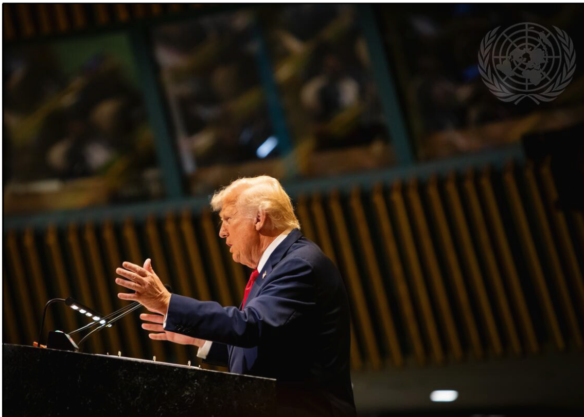
El presidente de los Estados Unidos, Donald J. Trump, interviene en el debate general del 80º período de sesiones de la Asamblea General de las Naciones Unidas, Sede de la ONU, Nueva York, 23 de septiembre de 2025.

En una extensa entrevista con The New York Times, publicada el 8 de enero de 2026 106 , el Presidente Donald Trump afirmó que el único límite a su poder global es su propio juicio moral. Preguntado por los frenos a su capacidad de actuar en el escenario internacional, respondió: "Sí,