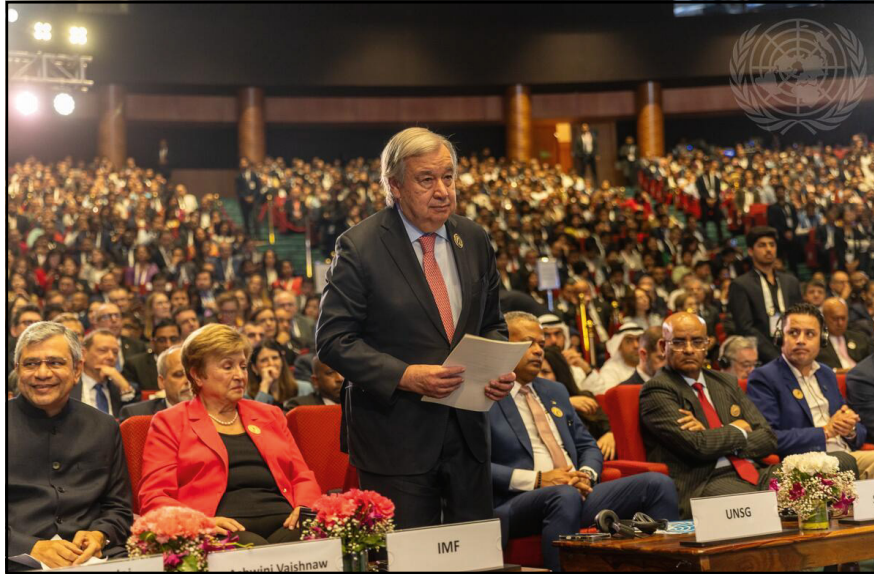
El Secretario General de las Naciones Unidas, António Guterres, interviene en la ceremonia de apertura de la Cumbre AI Impact, Nueva Delhi, India, 6 de noviembre de 2025.

La investigación académica ha identificado lo que se denomina la "paradoja de las promesas vacías" (paradox of empty promises) 70 : los gobiernos a menudo ratifican tratados de derechos humanos como mera fachada, disociando radicalmente la política de la práctica y, en ocasiones, exacerbando prácticas negativas en materia de derechos humanos.