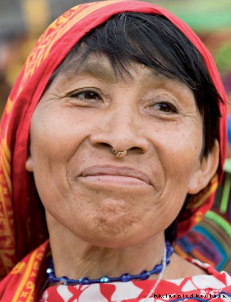
kuna i Panama