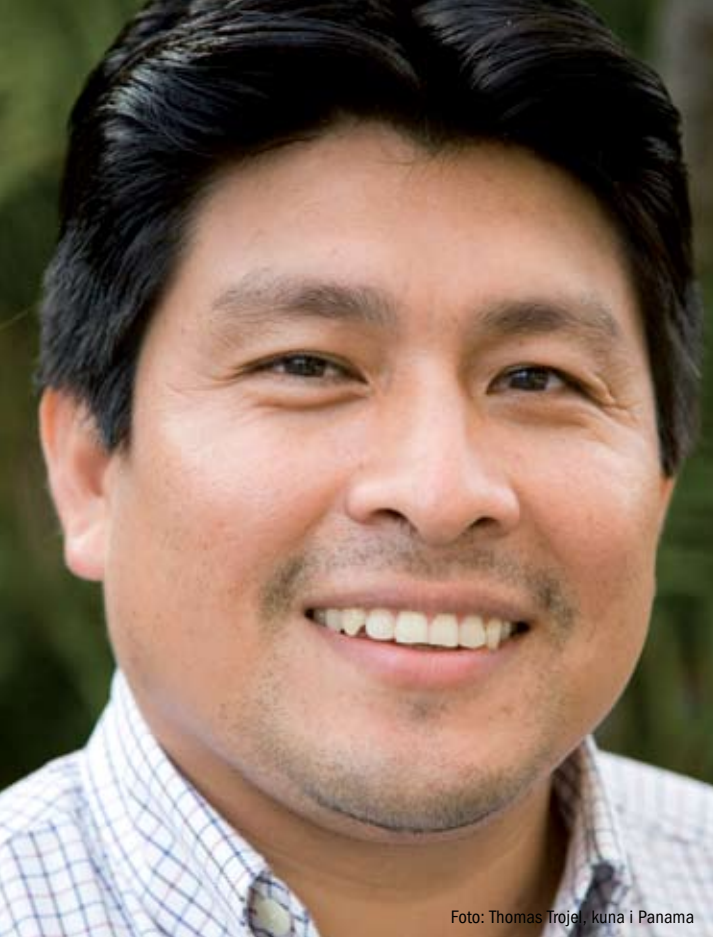
kuna i Panama