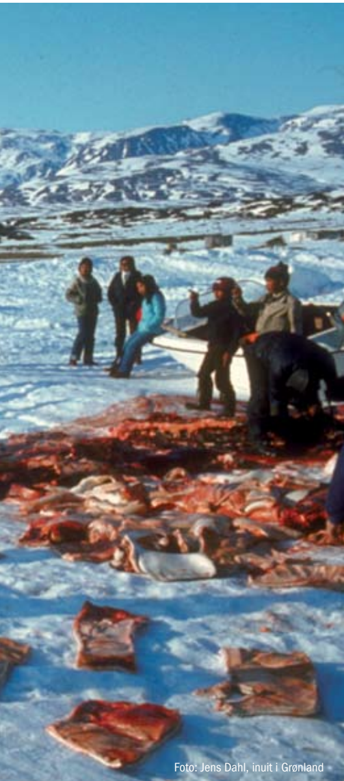
inuit i Grønland

også i EU. Den store enighed i samarbejdet mellem staten og et oprindeligt folk har skabt en betydelig legitimitet. Arbejdet i den dansk-grønlandske Selvstyrekommission har vist, at der langt fra altid er enighed mellem parterne, hvad angår Grønlands fremtid. På den anden side har Hjemmestyrets udvikling også vist, at øget selvbestemmelse ikke har svækket, men tværtimod i en række sammenhænge styrket samarbejdet uden på nogen måde at true statens integritet. Udviklingen har fundet sted inden for statens rammer, og selv hvor disse har været udfordret, er det sket i en fredelig proces. Eksemplets magt har været af uvurderlig betydning oprindelige folk verden over, idet de har kunnet pege på Danmark og Grønland som model og bevis på et mere rimeligt og ligeværdigt samspil mellem nationalstat og oprindelige folk. ■