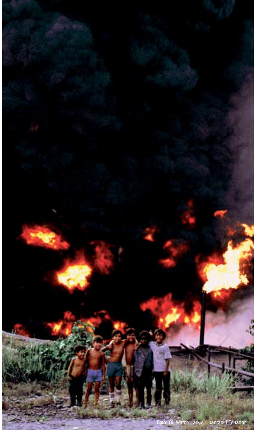
Huaorani i Ecuador

Retten til territorium for oprindelige folk omfatter brugsretten til jorden, hvorimod undergrunden per definition stadig tilhører staten. Således står de oprindelige folk juridisk stærkt i deres forsvar over for f.eks. vejbyggerier, indtrængende nybyggere, farmere og tømmersekskaber i deres territorium, hvorimod det kan være meget vanskeligt for oprindelige folk at