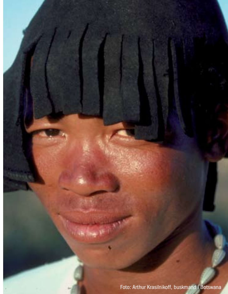
buskmand i Botswana

D e fleste forbinder nok oprindelige folk - eller indfødte folk som de også bliver kaldt – med mennesker, som lever i harmoni med naturen. Skal man forsøge at generalisere, kan man da også godt sige, at oprindelige folk sammenlignet med andre som f.eks. danskere tillægger naturen mere værdi og forurenere bemærkelsesværdigt mindre. Det er imidlertid ikke dette forhold, som definerer, hvem der er oprindelige folk, og hvem der ikke er det. At tilhøre et oprindeligt folk er en identitet, som udtrykkes med vidt forskellige prioriteter, tro og levevis som hos alle andre folk.