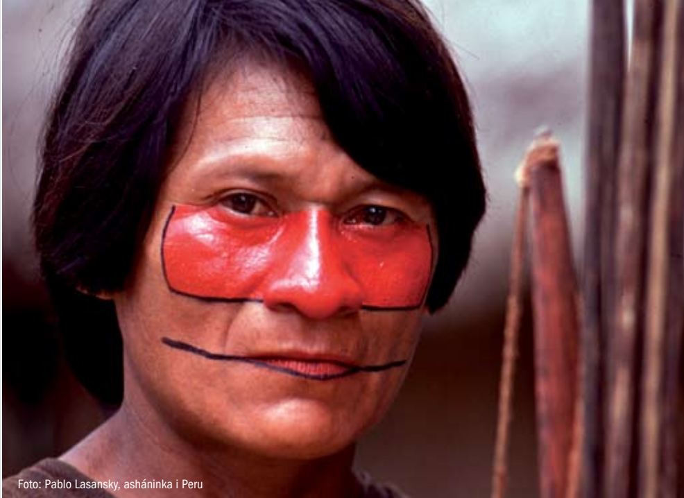
asháninka i Peru

eller magtelite i landet. Uden særlige rettigheder til at forsvare deres liv, territorium, sprog og kultur har et folk ikke store chancer for at overleve som sådan.