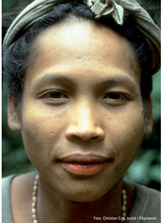
buhid i Filipinerne