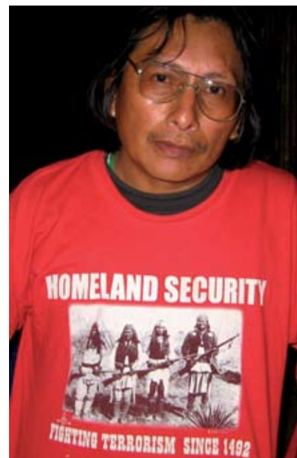
kuna i Panama

Nepenthes, IWGIA og IBIS støtter oprindelige folks rettigheder i direkte samarbejde med oprindelige folks egne organisationer. ■