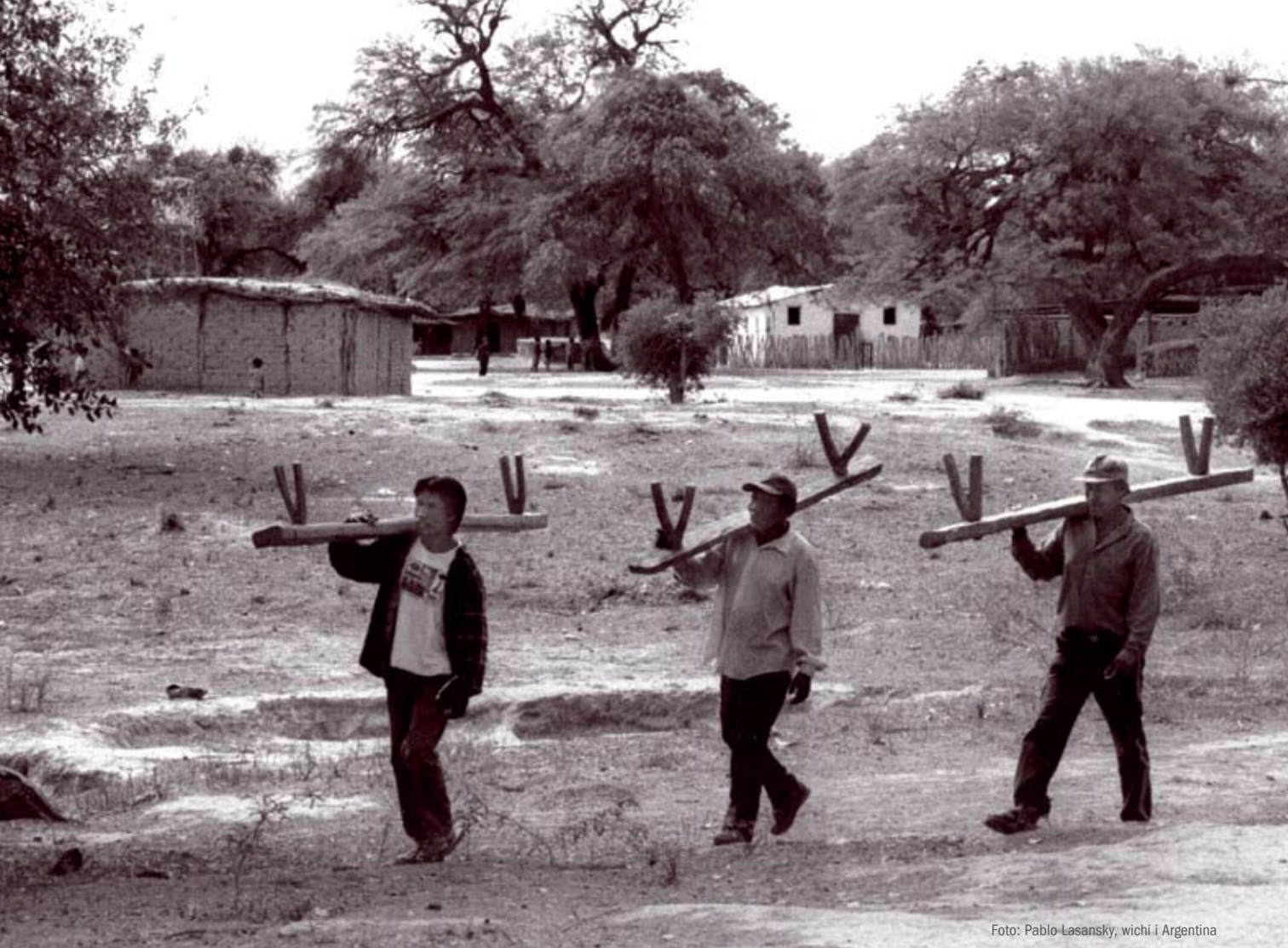
wichi i Argentina

Majoriteten af tosprogede børn i Latinamerika bliver undervist af lærere, der ingen viden har om hverken deres sprog eller kultur, og som måske allerhelst ville undervise andre børn end lige netop dem. For lærere, der ikke selv tilhører et oprindeligt folk, har det ikke høj status at undervise disse børn. Ikke sjældent fører lærernes manglende uddannelse inden for området til, at misforståelser og fordomme og myter om børnenes intellektuelle formåen opstår.