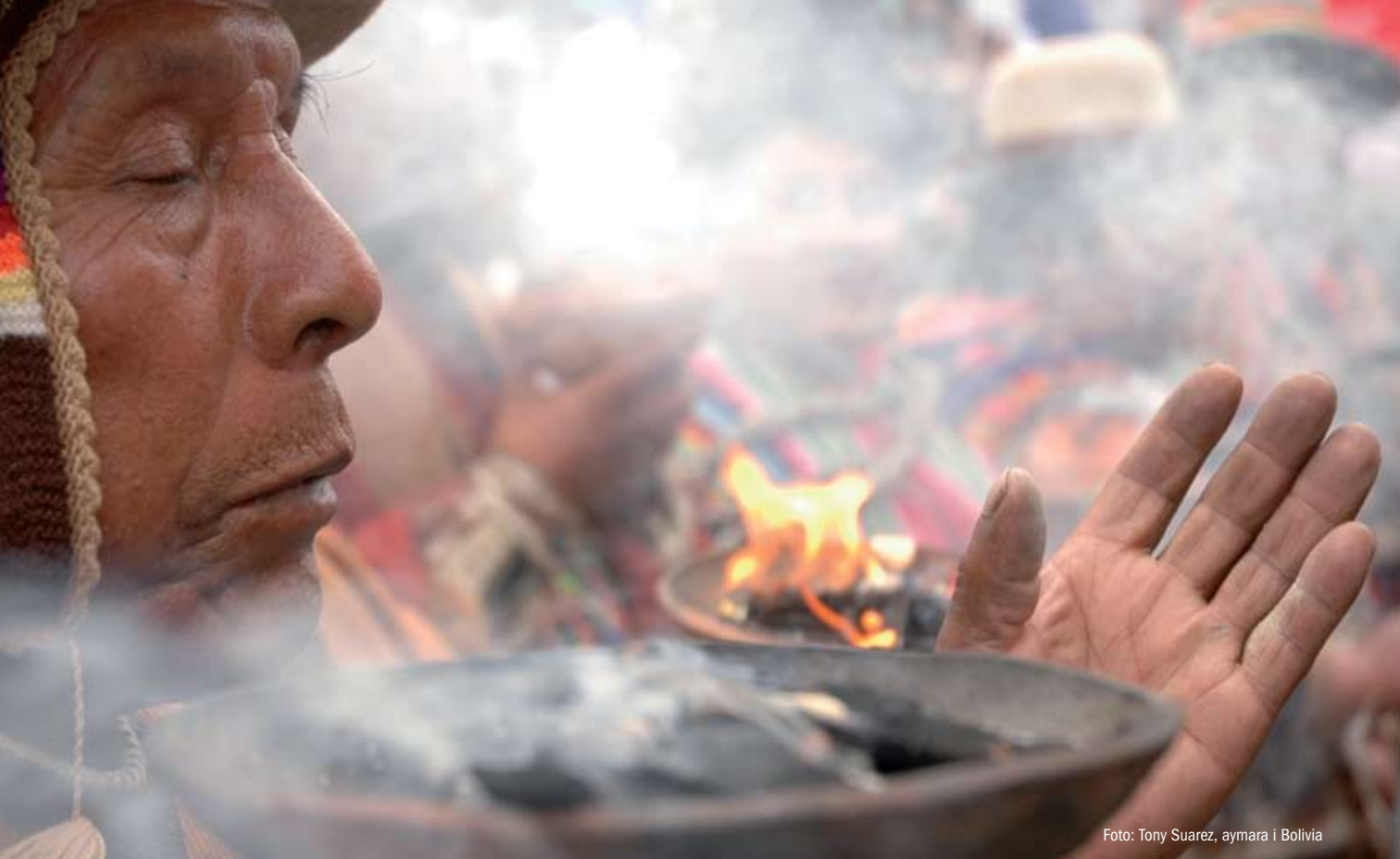
aymara i Bolivia