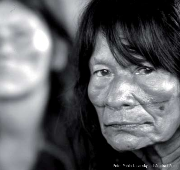
asháninka i Peru