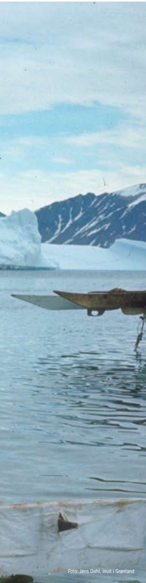
inuit i Grønland

G rundlaget for det officielle Danmarks støtte til oprindelige folk skal findes i 'Strategien for dansk støtte til oprindelige folk' fra 1994. Denne strategi var og er stadig ganske enestående, og Danmark har i flere henseender været foregangsland i støtten til oprindelige folk. Dette kapitel beskriver vigtige forhold, som alle er medvirkende til at forstå, hvorfor det er sådan.