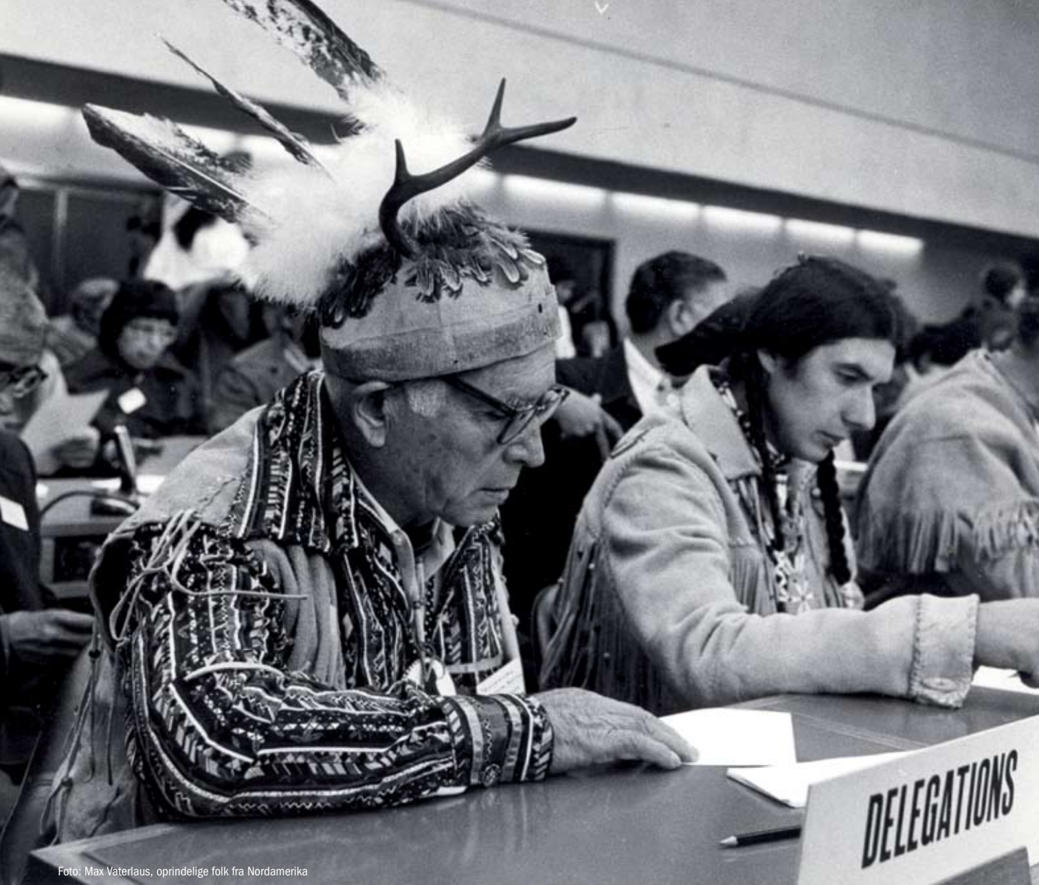
oprindelige folk fra Nordamerika

forespørgsler om hasteaktioner, at undersøge dem, samt at aflægge besøg i landene, hvorfra klagerne stammer. Derefter kommer Special Rapportøren med anbefalinger til det land, der kræver oprindelige folks menneskerettigheder, og til FN's forskellige menneskerettighedsorganer om, hvilke skridt de bør tage for at afhjælpe krænkelse eller for at undgå fremtidige krænkelse.