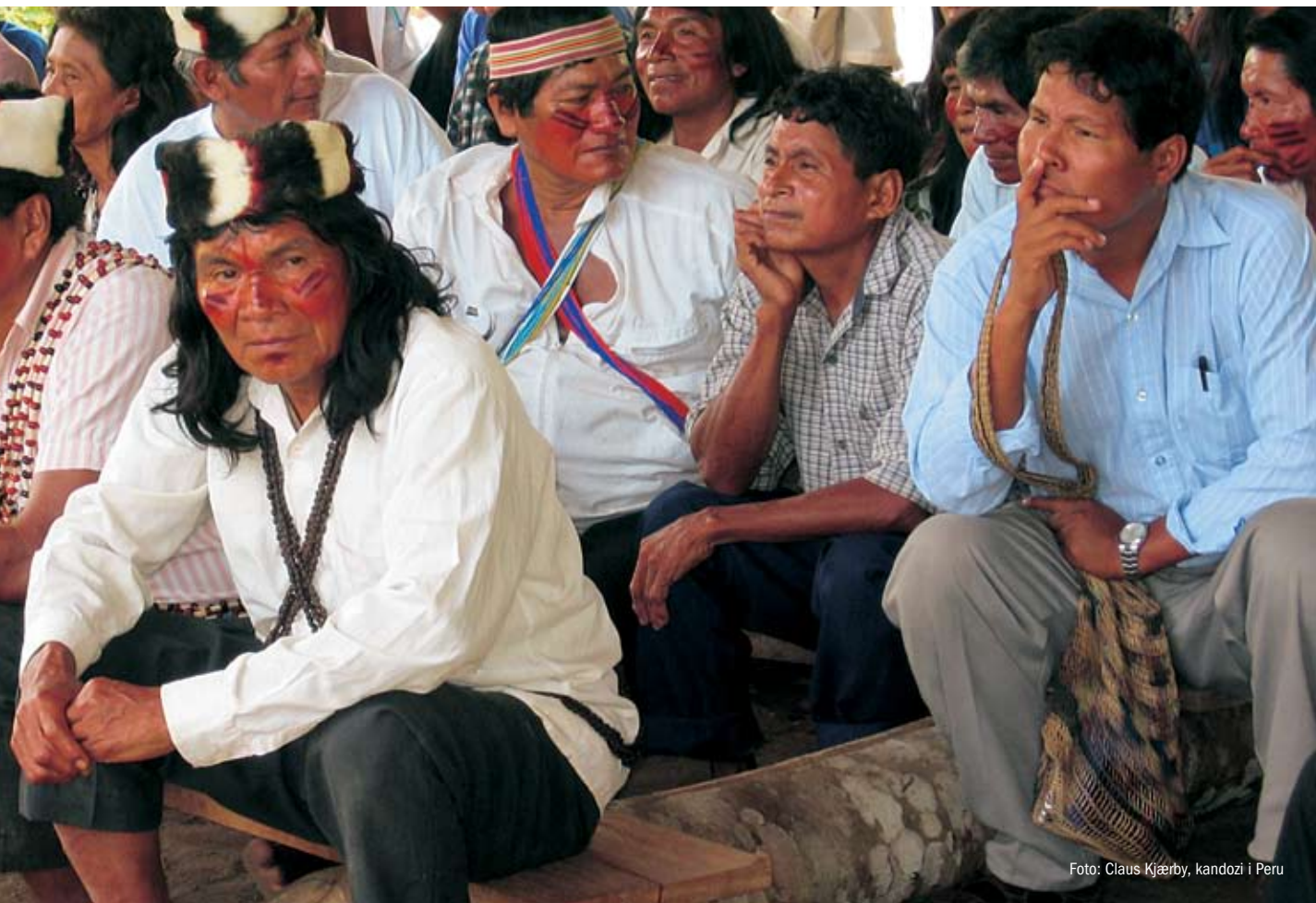
kandozi i Peru

Ikke alene har oprindelige folk ret til at regere deres territorier, de er ofte også de bedste til det. Et godt eksempel er rama-folket ved Nicaraguas caribiske kyst, der i alliance med efterkommere af afrikanske slaver har fået deres autoriteter officielt anerkendt som en territorial regering og nu er i færd med at planlægge et uddannelsessystem i harmoni med netop deres territoriale og kulturelle virkelighed. ■