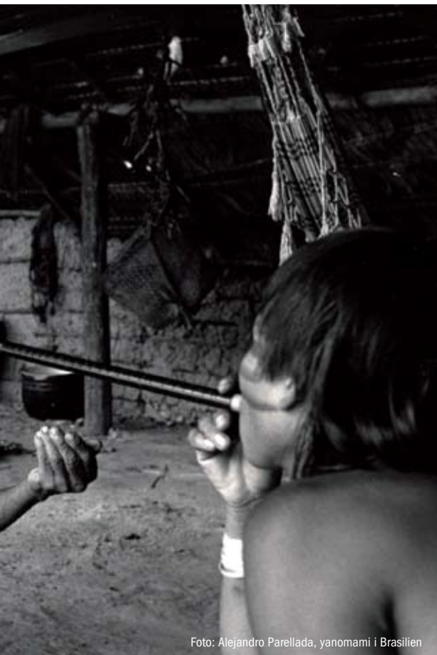
yanomami i Brasilien