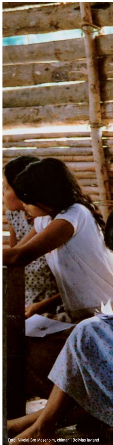
chiman i Bolivias lavland

Ofte bliver de oprindelige folks sprog omtalt som dialekter og ikke som rigtige, selvstændige sprog, og der er mange fordomme om, hvor lidt