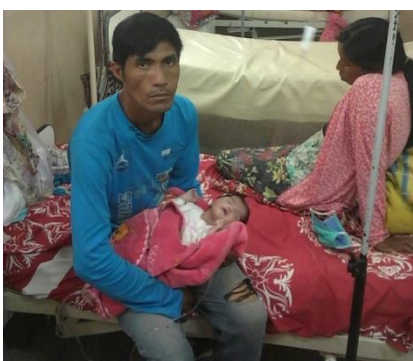
Ilustración 9 En el Hospital de El Potrillo

Gracias a Dios hubo personas que supieron ponerse un ratito en el lugar de un padre que estaba sufriendo, porque estaban separando de su hija recién nacida.