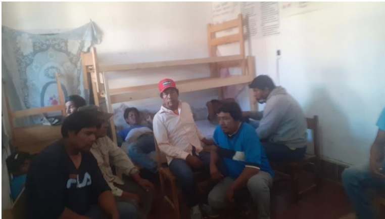
Ilustración 4 Detenidos en Ingeniero Juárez