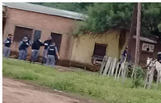
Ilustración 3 Operativo para detener a los 4

“Nosotros queríamos explicaciones del Director del Hospital de Ingeniero Juárez de porque los hisopan a los hermanos dos o tres veces y no les dan los resultados y el dijo que iba a venir hoy a la mañana y lo estábamos esperando pero llegaron un montón de policías en su lugar. Tres patrullas, otros en caballos y otros en motos”