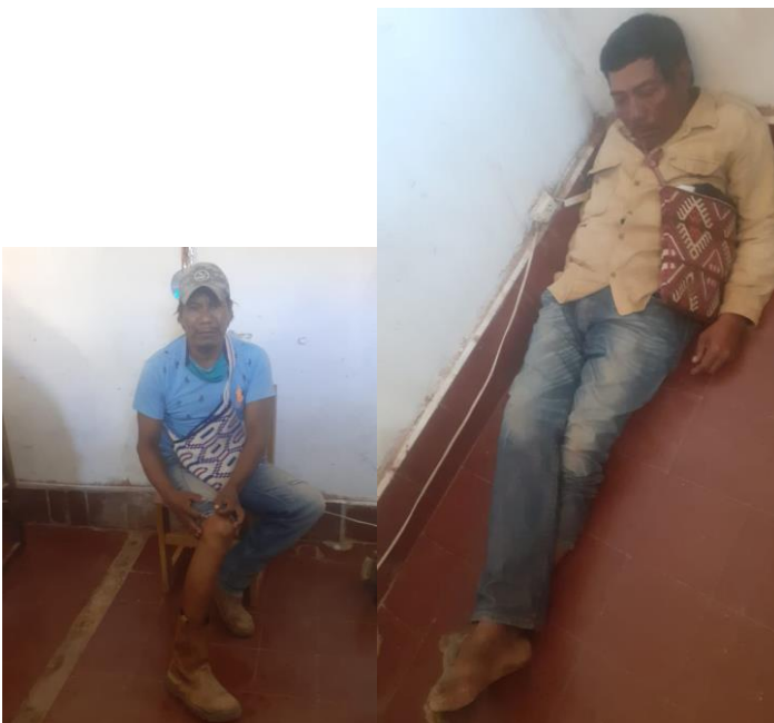
Ilustración 5 En la Comisaría