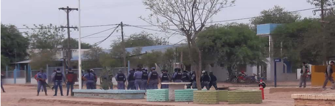
Ilustración 1 Frente al Hospital de El Chorro