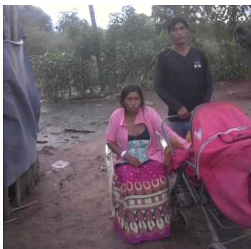
Ilustración 10 En su casa en El Potrillo

Denunciamos el mal trato sistemático a las personas de los pueblos originarios, negándoles información, separando a los enfermos de sus acompañantes, el abandono de personas en la calle, la violación del derecho de los recién nacidos a estar junto a su madre. Denunciamos este estado policial que llena de miedos a los ciudadanos. Denunciamos esta política sanitaria que separa a familias e impide el acompañamiento en situaciones de vulnerabilidad por la enfermedad.