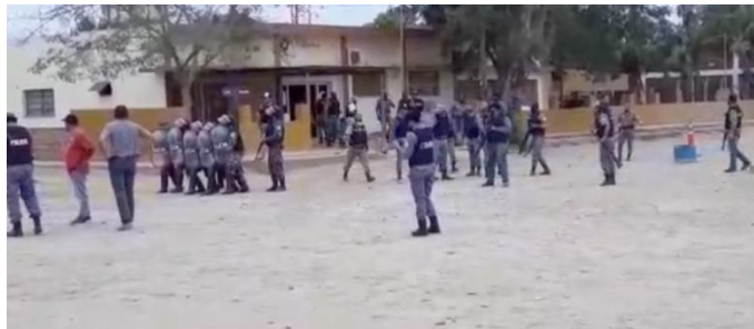
Ilustración 2 Efectivos frente a la Comisaria de El Chorro

La persecución al pueblo Wichí. El uso desmedido de fuerzas policiales. La represión y criminalización de la protesta.