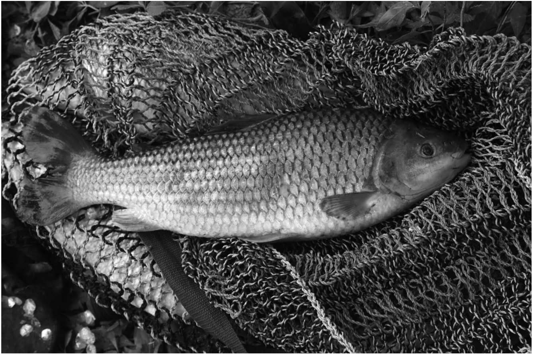
Pescado sobre una yica. Río Pilcomayo, Salta.