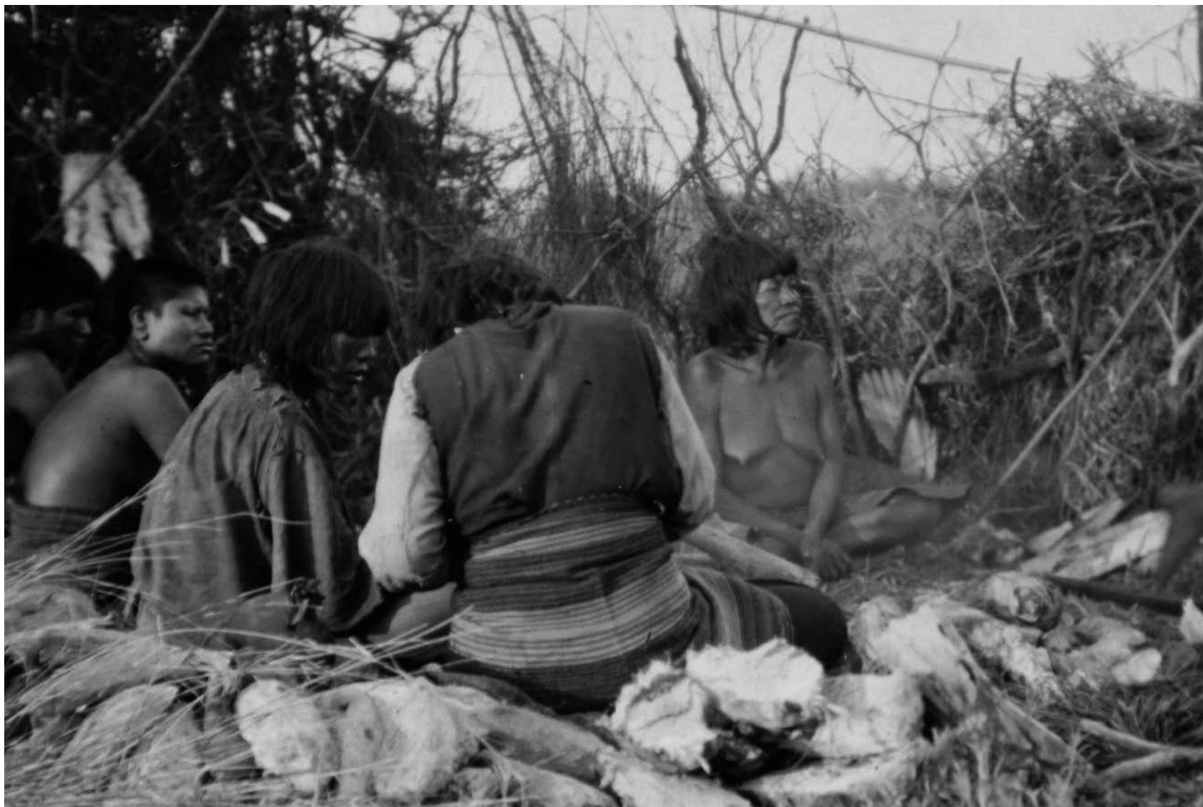
Aborígenes del Gran Chaco.