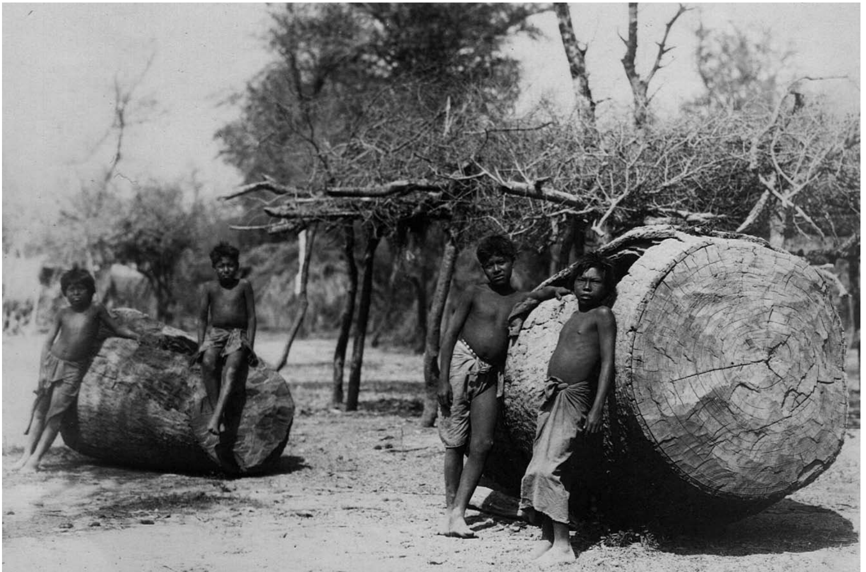
Aborígenes del Gran Chaco.