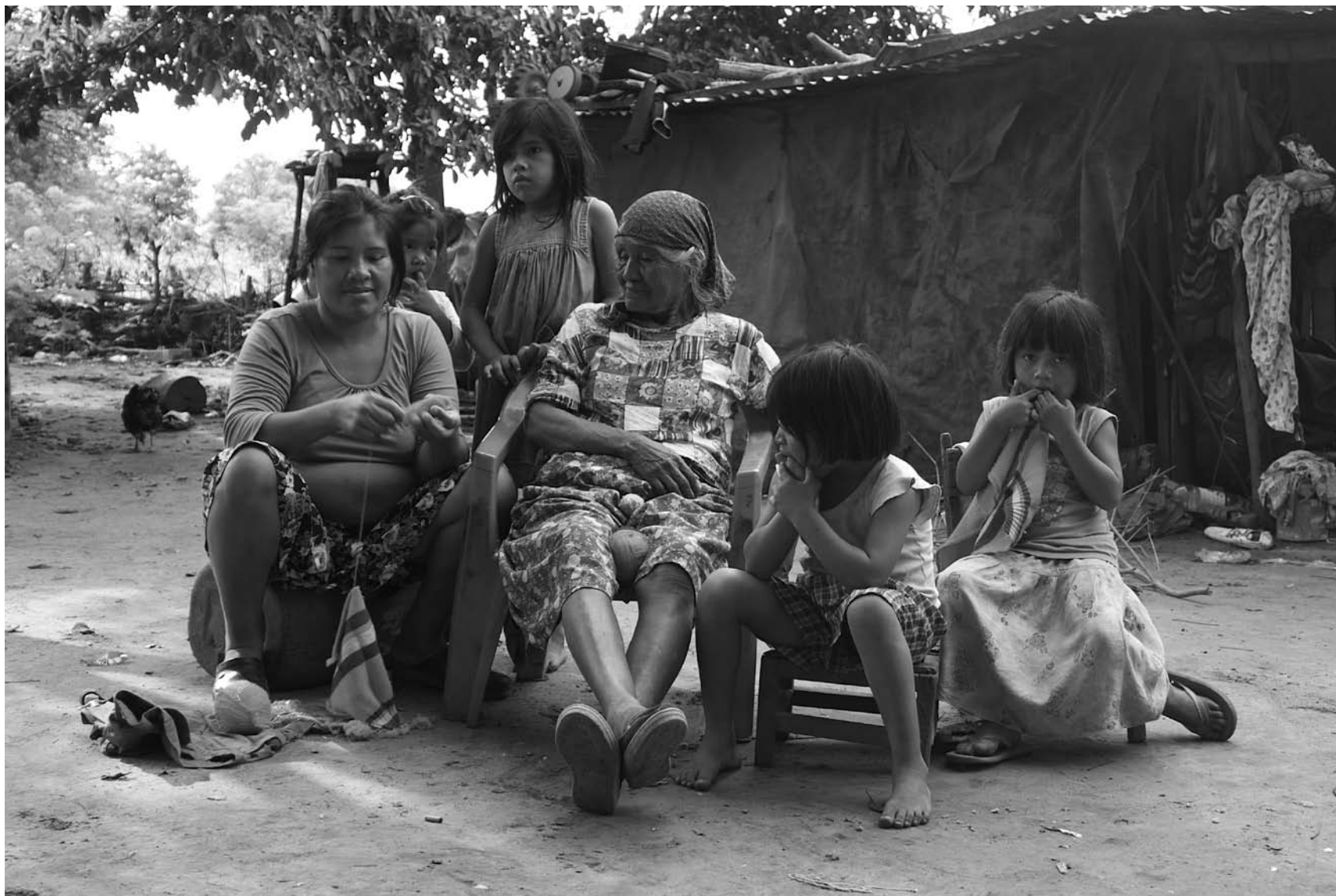
Familia wichí, Comunidad El Algarrobo, Ruta 86 (Tartagal, Salta).