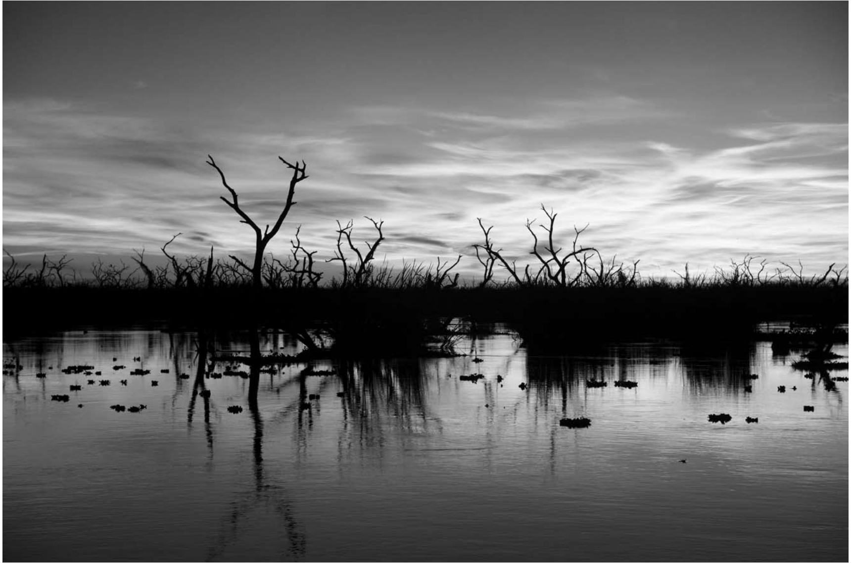
Bañado La Estrella, Formosa.