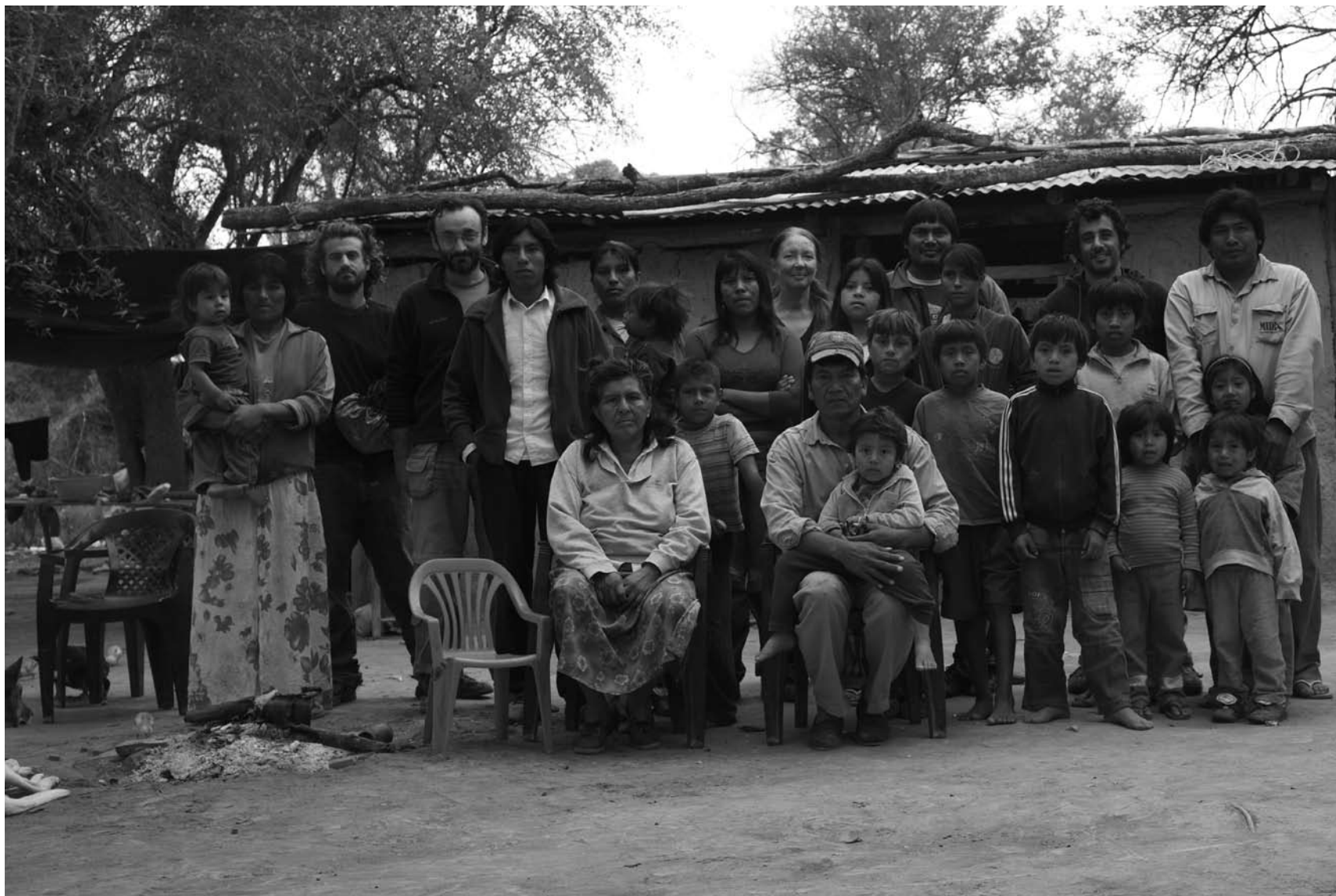
Comunidad El Descanso, Bañado La Estrella, Formosa, con integrantes del equipo documental y de la Asociación Civil Rumbo Sur.