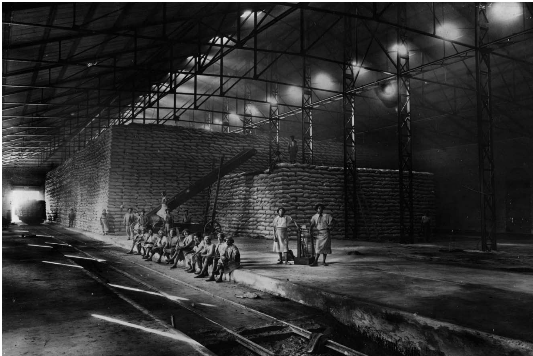
Ingenio azucarero en el chaco salteño.