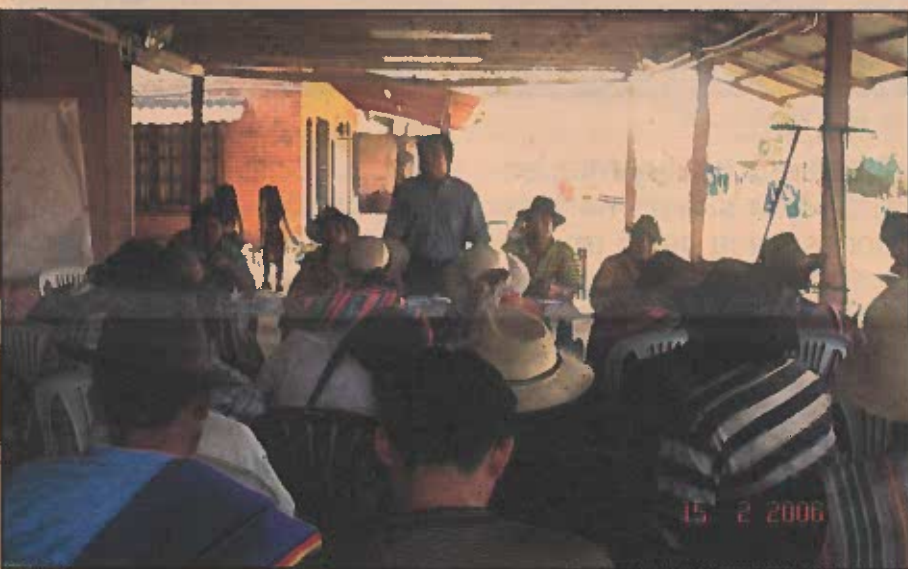
Reunión Pacto de unidad

Por Consiguiente, en esta reunión previa a la cumbre social, se analizó y comparó el proyecto del gobierno con la propuesta del Pacto de Unidad, donde se identificaron puntos complementarios y otros divergentes. Entre los puntos co-